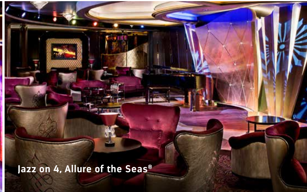
Jazz on 4, Allure of the Seas®