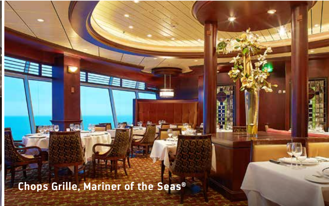
Chops Grille, Mariner of the Seas®