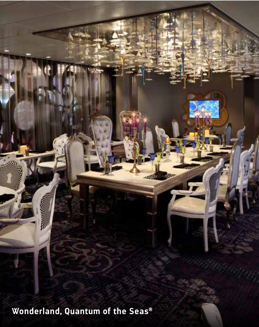
Wonderland, Quantum of the Seas®

Es posible que se apliquen tarifas de compra. Los restaurantes varían según el barco.