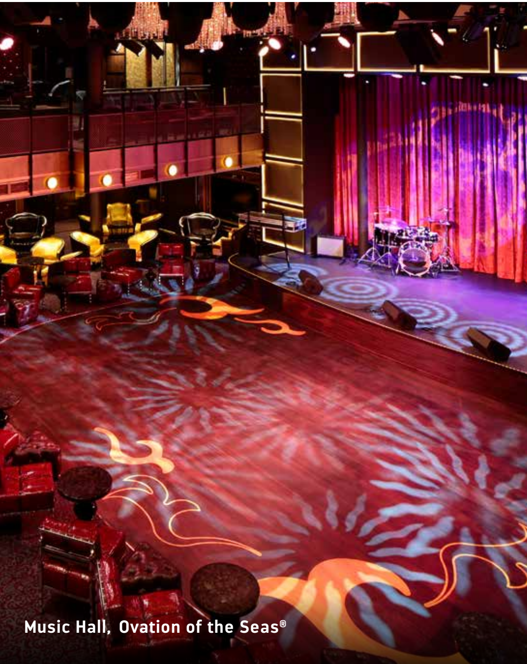
Music Hall, Ovation of the Seas®

Es posible que se apliquen tarifas adicionales o cargo por compra a algunos locales. Consulta a tu planificador de bodas coordinador en tierra por precios y disponibilidad. Los locales varían según el barco.