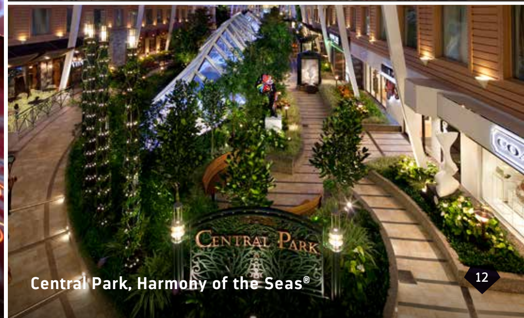
Central Park, Harmony of the Seas®