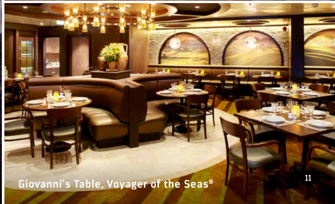
Giovanni's Table, Voyager of the Seas®